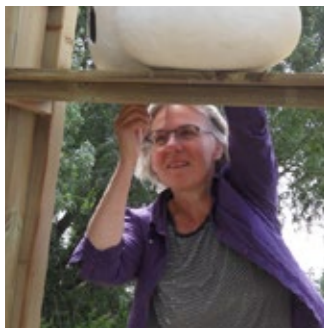
Dorothe Arts Docent beeldend

“Ik genoot als de deelnemers geconcentreerd aan het werk waren. Aan de ene tafel werden aquarellen gemaakt, terwijl andere deelnemers zich bogen over het patroon van de kleding. Aan een derde tafel werd diep nagedacht over het rijdende stationnetje, terwijl in de gang dozen werden geschilderd. Met steeds de vraag in het achterhoofd: wat kunnen we hiermee in de dansvoorstelling? En daar vindt alles een plek. Prachtig hoe de (foto)projecties, objecten, beelden en dansers samenkomen op de klanken van de muziek. Ik denk aan het enthousiasme en de kracht van de deelnemers, ongehinderd door leeftijd of wat dan ook. Een onvergetelijk project.”