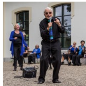
Castellum Singers O.l.v. Jan van Wieringen

“Voor iedereen was dit een ‘ontdekkingsreis’. Ik was vereerd dat ik gevraagd werd. Ik wilde de deelnemers van de fotografiegroep op een plezierige manier een sprong laten maken in hun fotografie. Samen zochten we onze weg hoe de foto’s ondersteunend konden zijn voor de voorstellingen. Met veel geduld en aandacht. Gezellig en leerzaam. Ik heb het heel leuk gevonden mijn fotografiekennis te delen. En om onderling echt een groep te gaan vormen. Naast fotografie onderwerpen is ook menig maatschappelijk onderwerp gedeeld. Interessante discussies. De shoot in Zwembad De Wetering, mijn sprong van de duikplank, filmend met GoPro in de hand, zal me altijd blijven.”