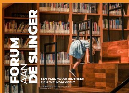
Illustratie: Hart voor Houten